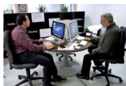
Espace ressources à INITIATIVES Montpellier

Peu à peu le Centre de ressources - et ses utilisateurs - tissent des pratiques affinées pour plier le web à ses besoins. Etre plus malin que tous les automatismes, tel est l'« objectif Web ».