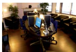
Espace ressources à INITIATIVES Paris

Ça y est ! Le service transversal d'INITIATIVES, portant le nom énigmatique de « RID », est parti à la conquête ardue et quotidienne de l'espace internet, des « NTIC » et des ressources immatérielles - précises si l'on sait s'en servir ; inutiles si l'on se contente de regarder les trois premières des millions de réponses que « google » apporte à la moindre de nos questions, quasi à la vitesse de la lumière.