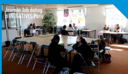
Journée Job dating à INITIATIVES Paris