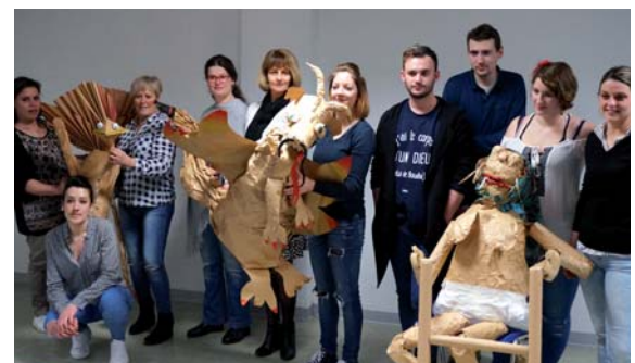
Atelier création avec les stagiaires en formation d'AES à Montpellier