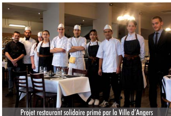
Projet restaurant solidaire primé par la Ville d'Angers